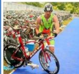
Les militaires ont dominé le triathlon courte distance. Hier à Belfort.