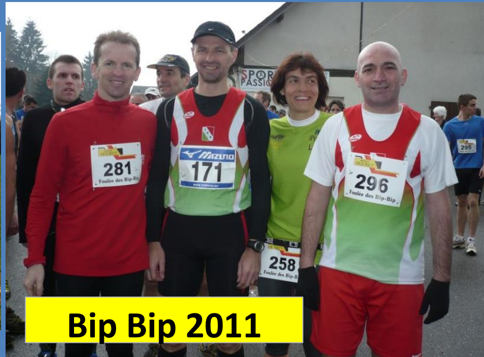
Bip Bip 2011