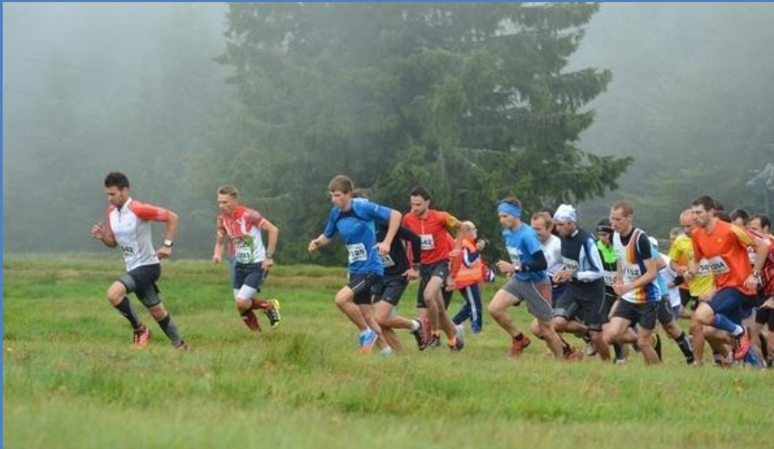
Crêtes Vosgiennes 2013