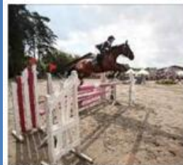
Les cavaliers ont pris de la hauteur. Hier à Valentigney.