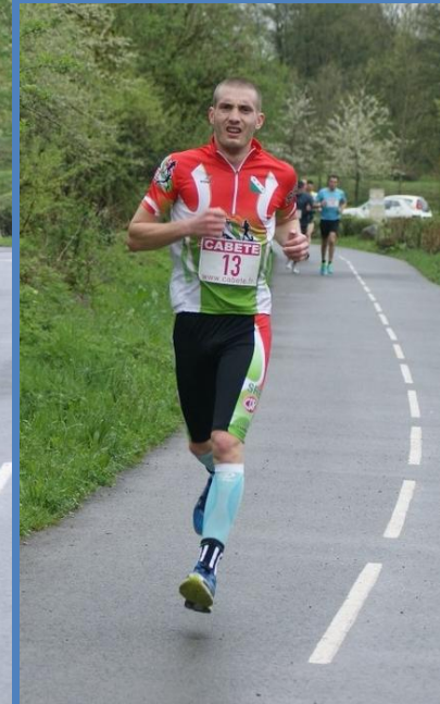
10km Andelnans 2013