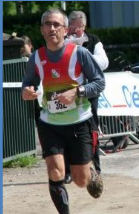
Trail du Sapeur 2013