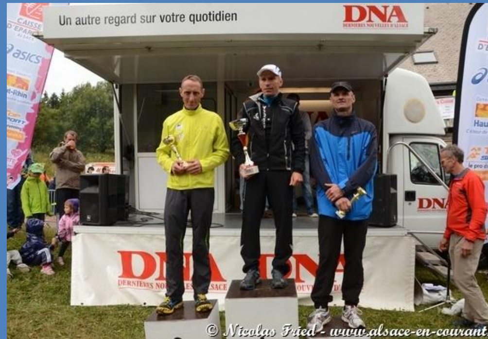
Victoire Catégorie aux Crêtes Vosgiennes 2013