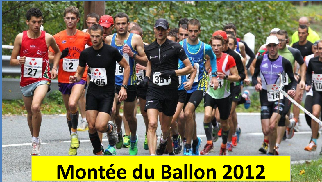
Montée du Ballon 2012