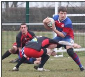
Les rugbymen de l'Aire urbaine n'ont laissé aucun point à leurs adversaires ce dimanche.