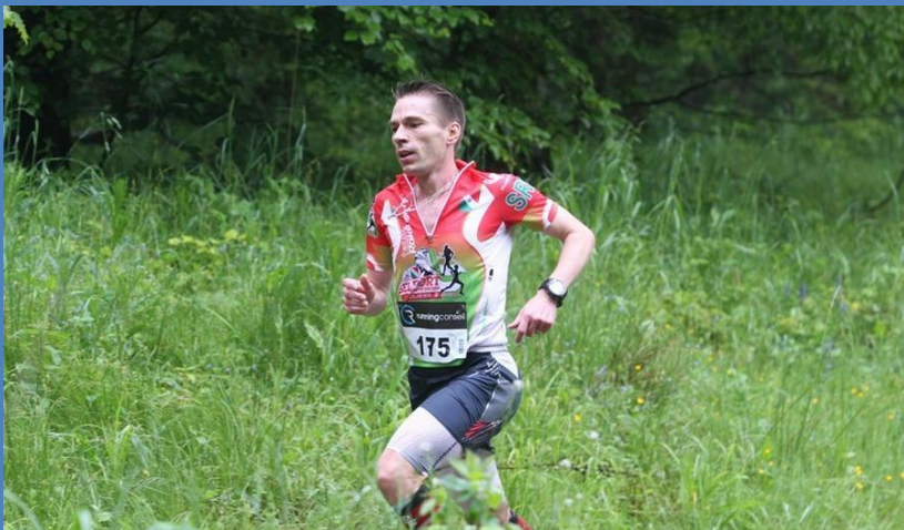
Tour du Grammont 2013